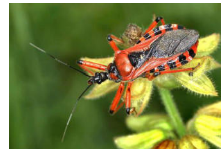
Reduviidae – Raubwanzen (7/14)