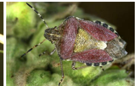
Pentatomidae – Baumwanzen (31/51)