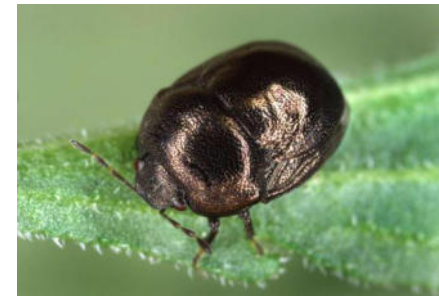
Thyreocoridae – “Skarabäuswanzen“ (1/1)