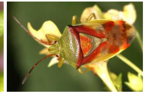
Acanthosomatidae – Stachelwanzen (4/7)