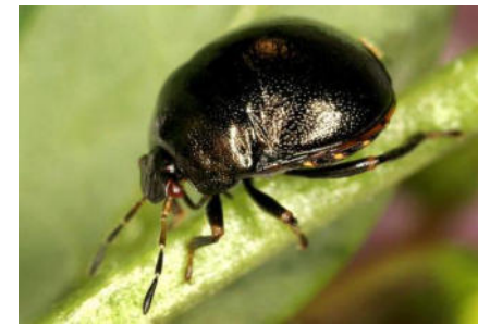
Plataspidae – Kugelwanzen (1/1)