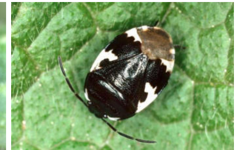
Cydnidae – Erdwanzen ( 11/16)