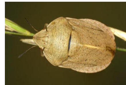
Scutelleridae – Schildwanzen (5/10)