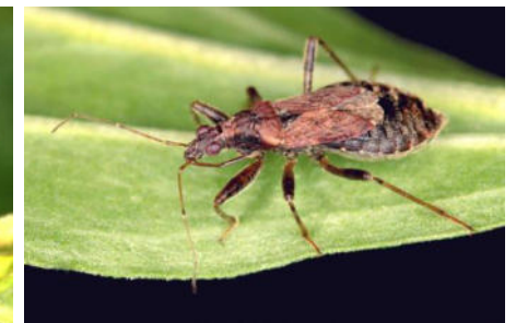
Nabidae – Sichelwanzen (4/16)